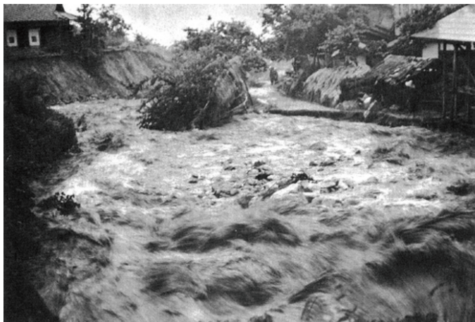
竜西線～下平駅の間の田沢川の濁流 この後更に濁流の強さが増し、右手の建物もあつという間に流されてしまった