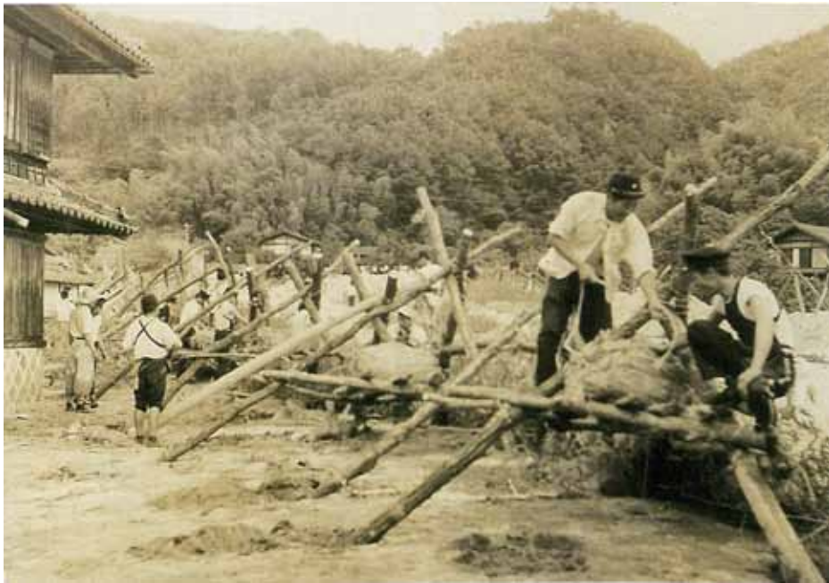
福沢川が氾濫。（撮影者を含む松川町消防団が）山から切り出した檜の木で牛枠組をした。後方山川が上流。

出典 「天竜川のあの頃」 P.181 / 「三六災害の思い出—松川町史学会」 p.23