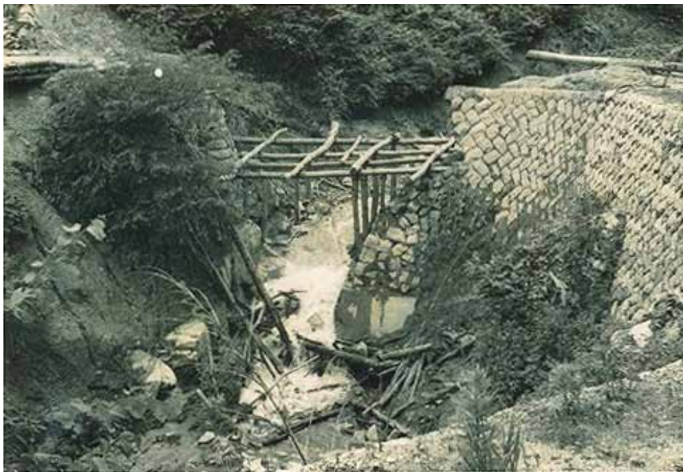
濁流で崩壊した橋