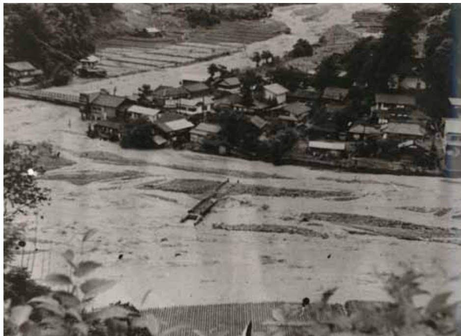
濁流により流された橋梁