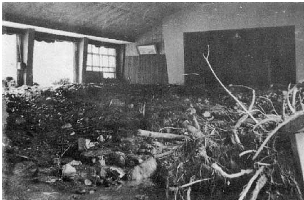
鹿塩中学校体育館に流入した土砂