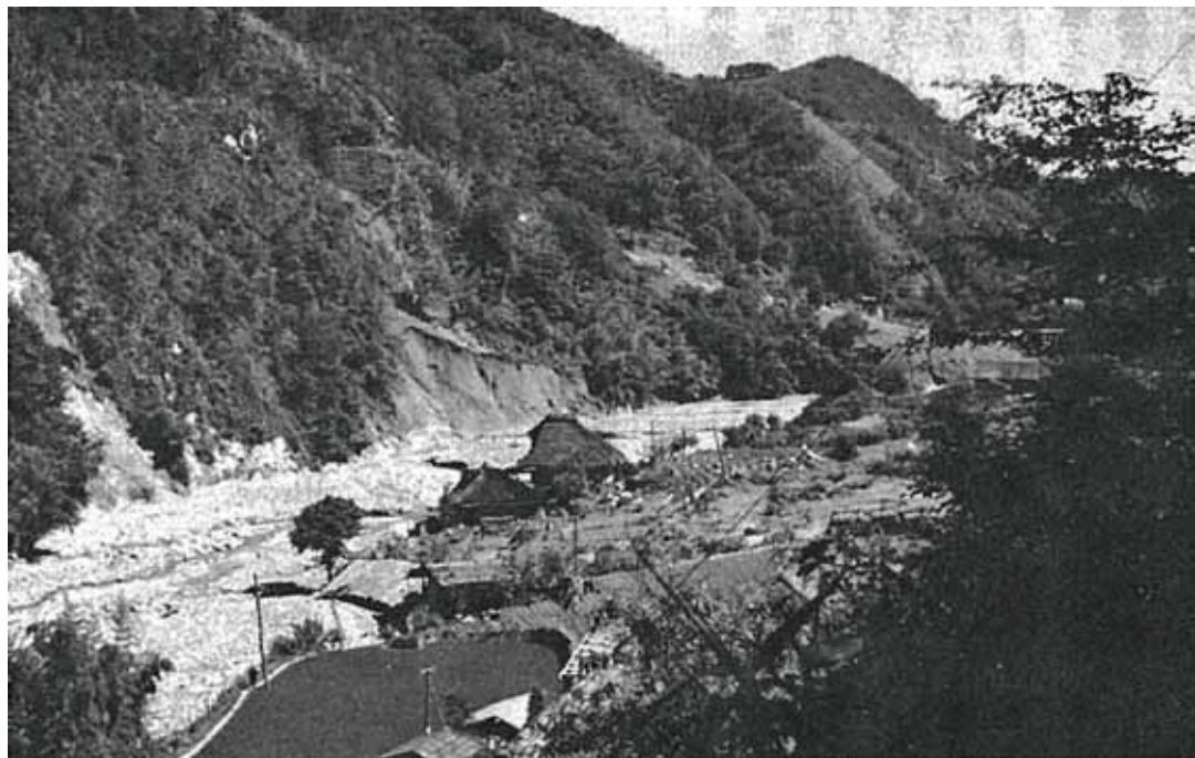
被災直後の四徳川下流の下村付近