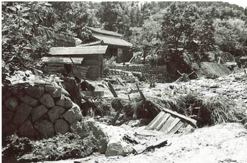
水が引いた後の惨状。民家周辺に折り重なるように積もった土砂や流木