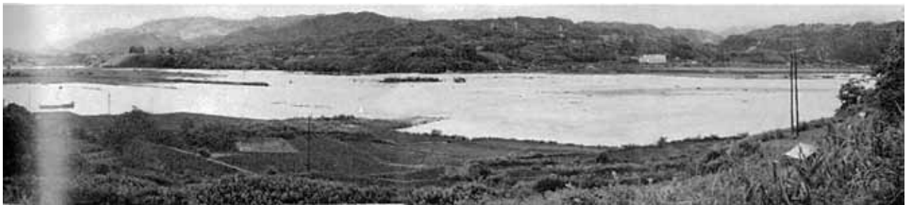
水びたしになった南田島