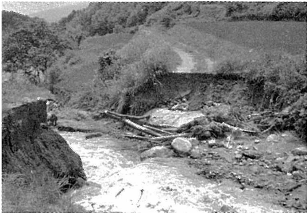
押し流された北山方線（西丸尾）