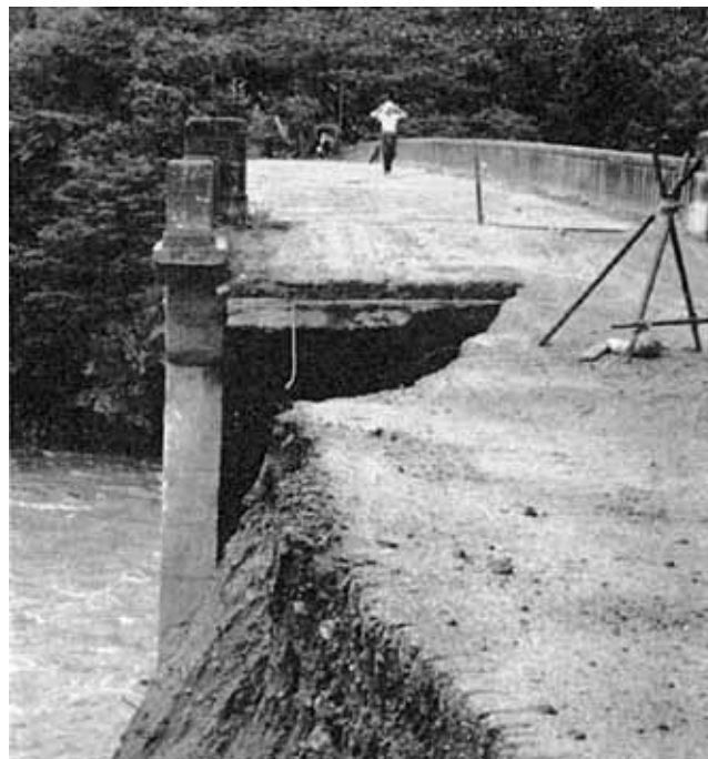
村の玄関ともいわれる坂戸橋の橋台が洗われ、自動車が通行不能となった。