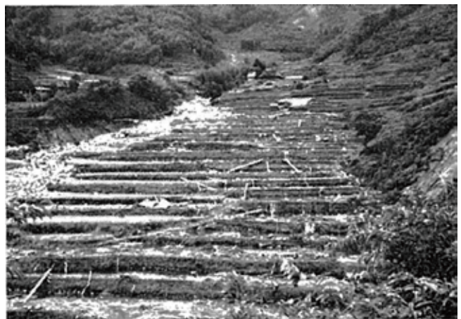
階段状の水田も土砂と流木に覆われた