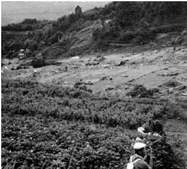
手取沢に荒らされた黒牛地区