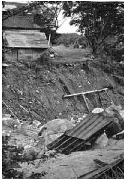
大谷沢に押し流された県道