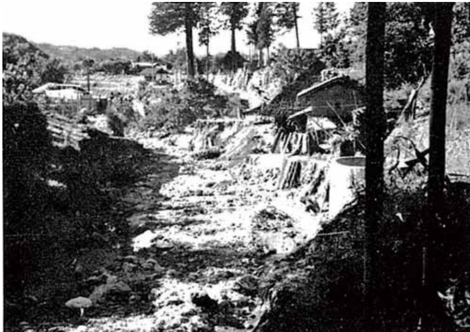
大谷沢の水で民家の土台が発掘される