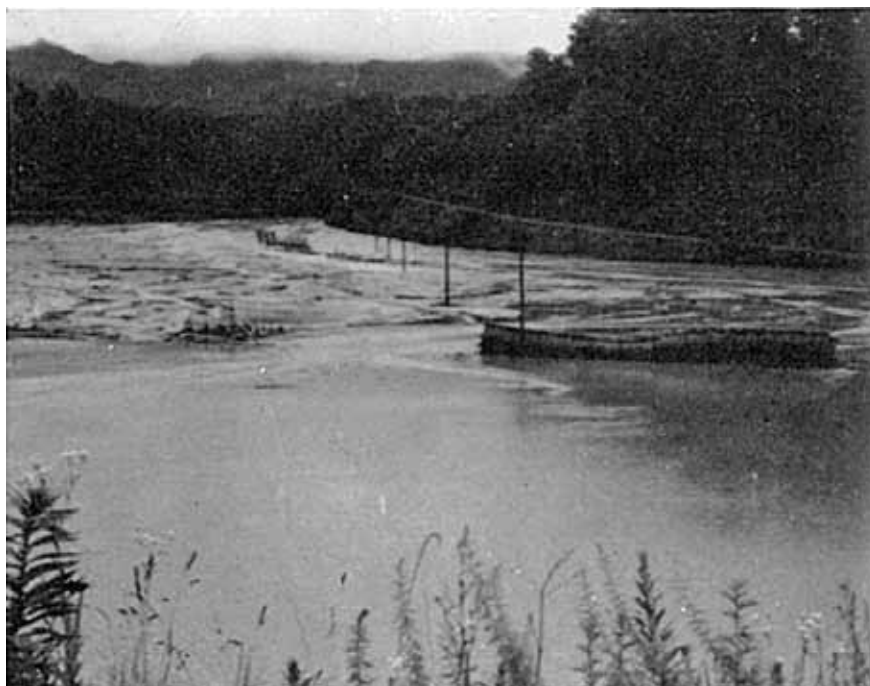
災害直後のほうらい沢