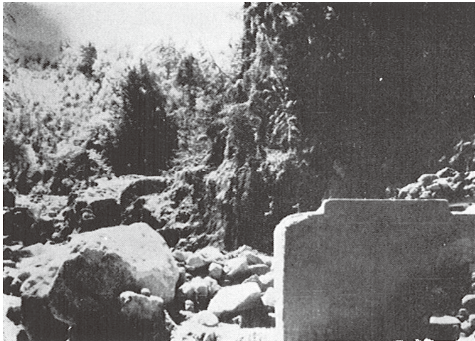
崩壊流失した水源池と接合井（飯島町日曾利水道）