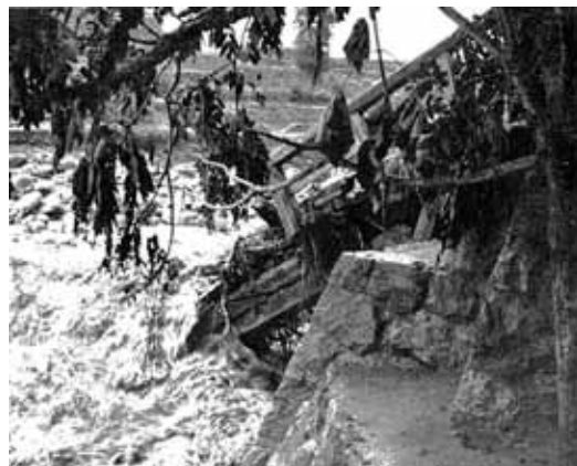
流失切断された下曾倉橋