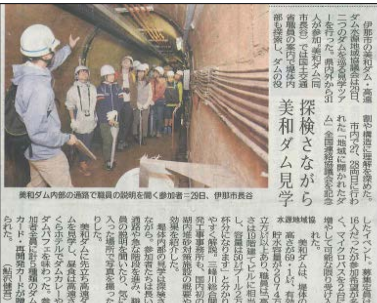
平成30年9月30日 長野日報

●協 力：国土交通省 天竜川ダム統管理事務所、三峰川総合開発工事事務所、長野県企業局 南信発電管理事務所