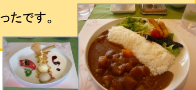
昼食：高遠ダムカレー・ダムパフェも (高遠さくらホテル)