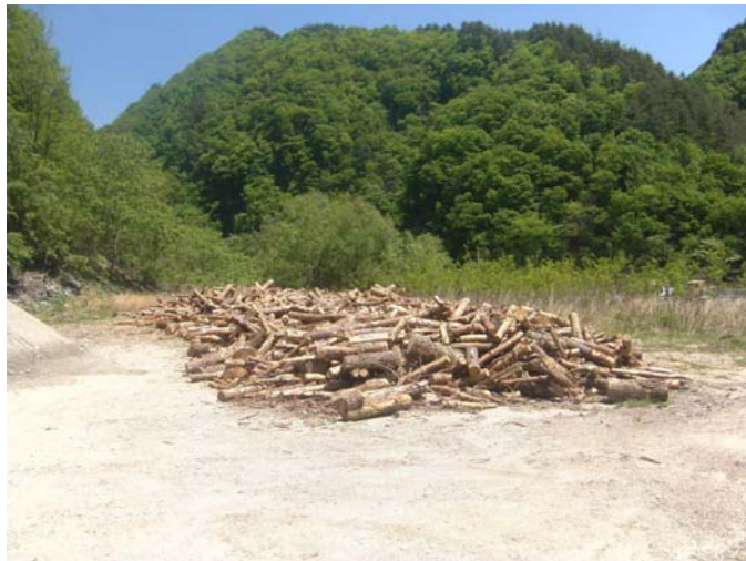
半の沢集積所 伐採木（松）集積状況