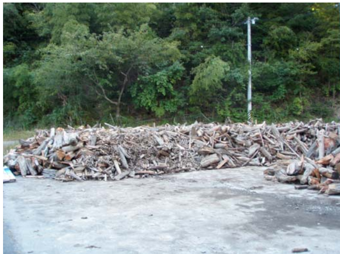
四徳集積所 流木集積状況