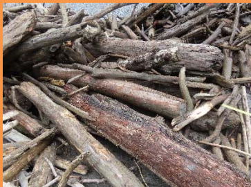
○原木 径15～60cm程度 長さ2～5m程度

～国土交通省天竜川ダム統管理事務所からのお知らせ～ ダム湖に流れ込んだ流木の有効利用を図るため、 無料配布 を行います。 薪やマルチング材、アート作品などに利用してみたいはいかがですか？