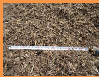
○チップ 幅1～3cm程度 長さ3～7cm程度