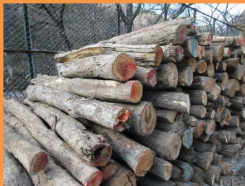
○玉切り 径20cm程度 長さ30cm～2m程度