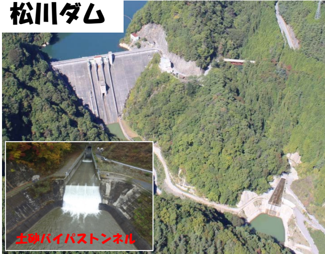
土砂バイパストンネル