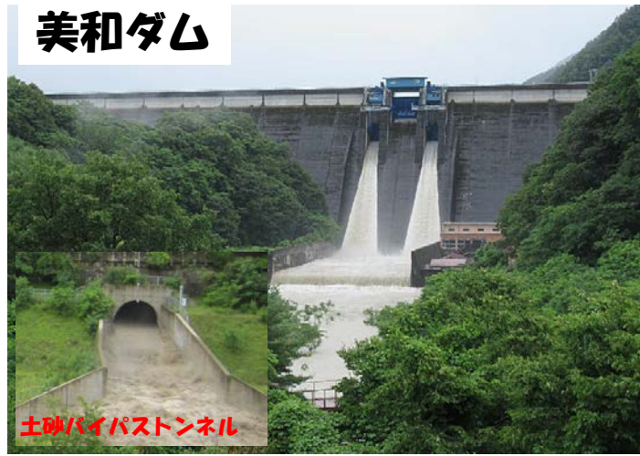
土砂バイパストンネル