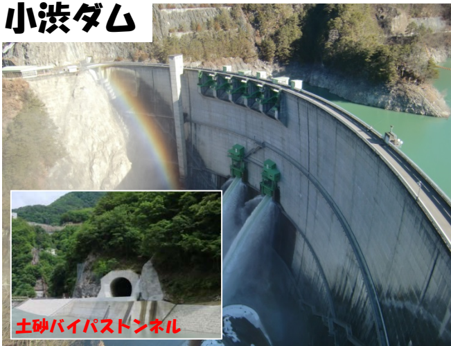
土砂バイパストンネル