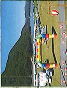
② ⑥ 美和湖公園