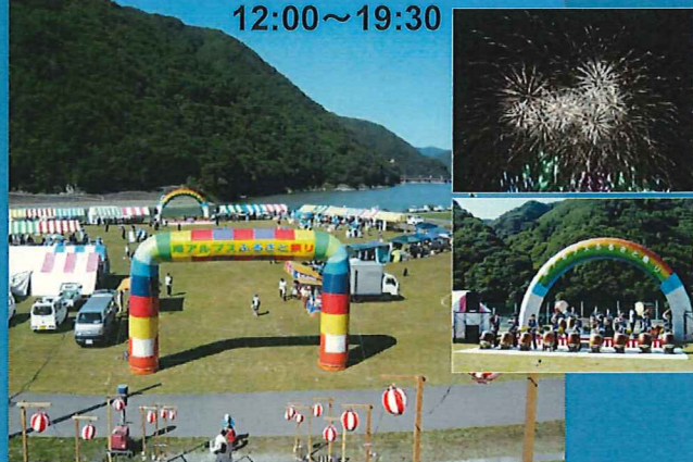
花火大会などの催し予定!!