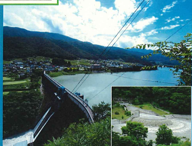
美和発電所とバイパストネルも見学