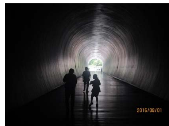
バイパストンネルの中の様子 ※今回「吐口」から「呑口」まで、トンネル内を 車両で移動します