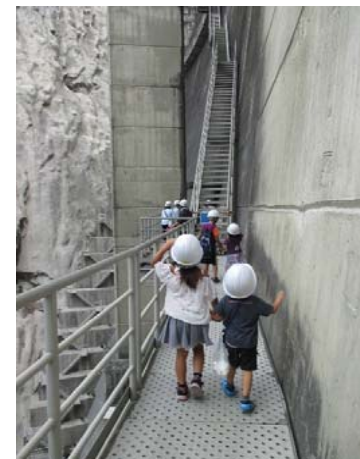
小渋ダム探検の様子