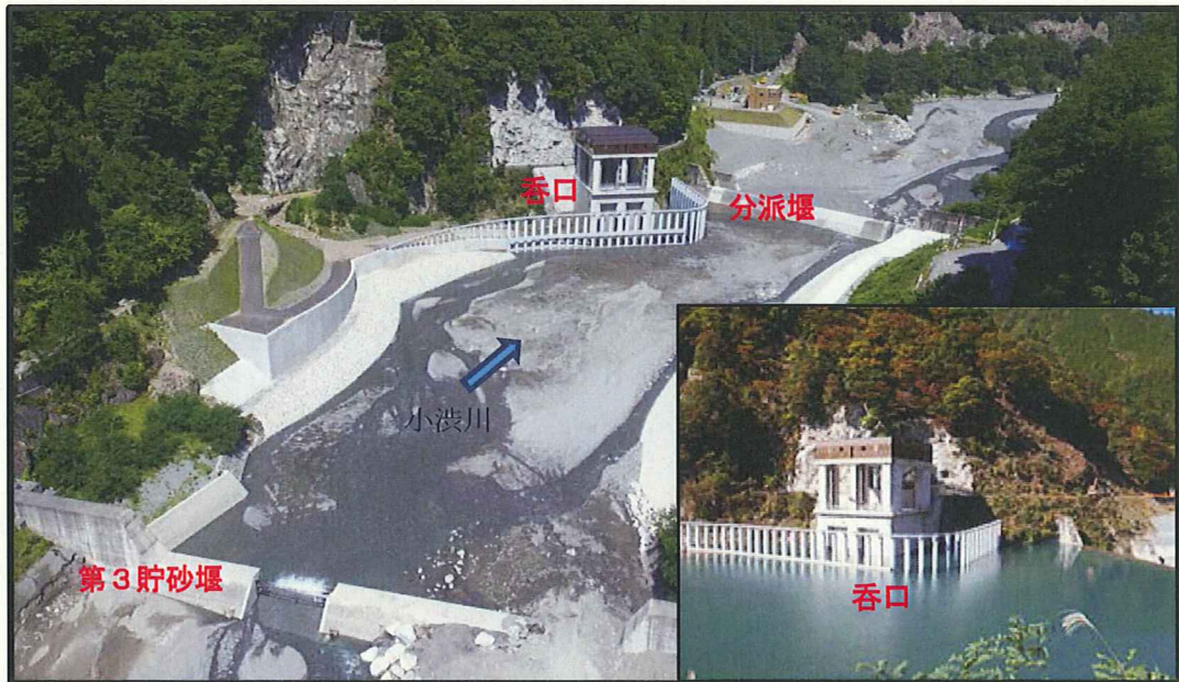
呑口（大鹿村大河原地先）