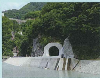
完成間近のバイパストンネル

ダム内部は、普段入ることができませんが、この日だけ特別に施設内を開放します。ゲートを間近に観て大きさを実感してみませんか。