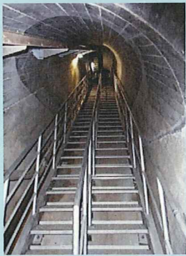
監査路は15°C、涼しいよ