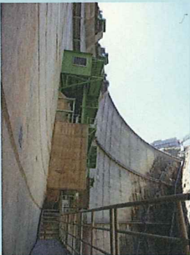
ゲートの真横へ接近