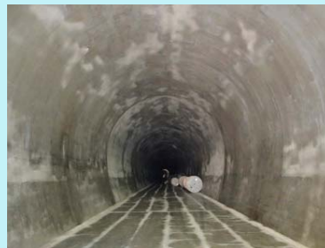
完成したばかりのトンネル