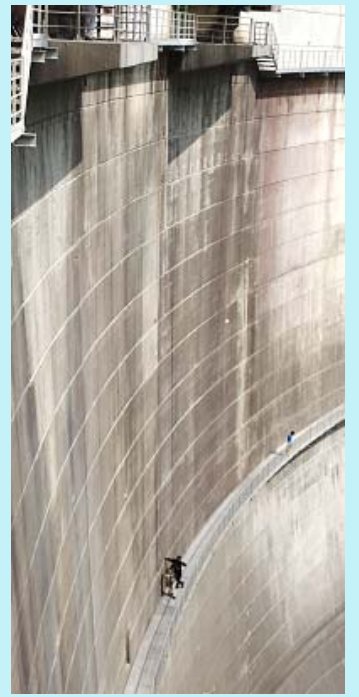
足も竦む高さに驚き