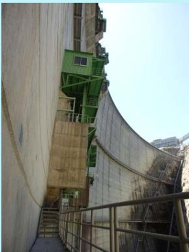
ゲートを真横から