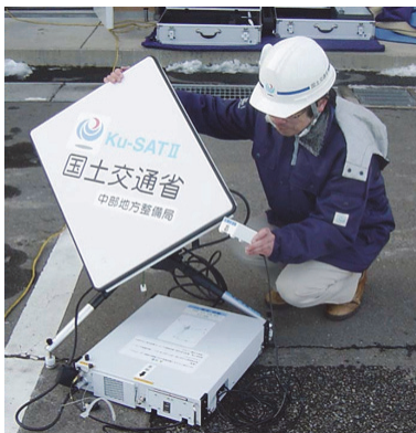
可搬衛星通信装置 (Ku-SAT)