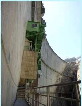
ゲートを真横から