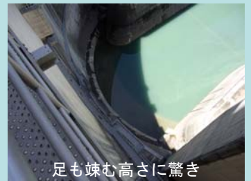
足も竦む高さに驚き

ダム内部は、普段入ることが出来ませんが、この日だけ特別に施設内を開放します。 ゲートを間近にして大きさを実感してみませんか。 ダムや建設が進む土砂バイパストンネルを探検するもよし。 散歩しながら写真を撮るもよし。 ゆっくり巡っておよそ1時間。 ぜひ、この機会にいかがでしょうか。