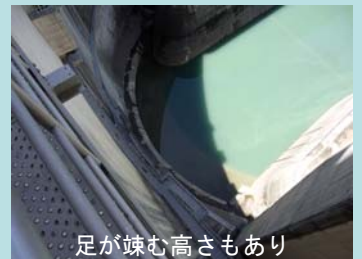
足が竦む高さもあり

ダム内部は、普段入ることが出来ませんが、この日だけ特別に施設内を開放します。 ゲートを間近にして大きさを実感してみませんか。 ダムや建設が進む土砂バイパストンネルを探検するもよし。 散歩しながら写真を撮るもよし。 ゆっくり巡っておよそ1時間。 ぜひ、この機会にいかがでしょうか。