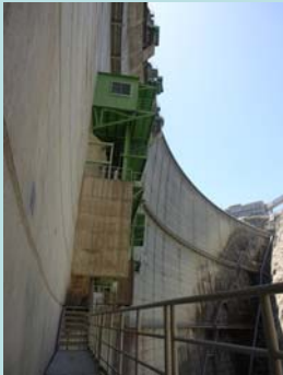
ゲートは真横から

ダム内部は、普段入ることが出来ませんが、この日だけ特別に施設内を開放します。 ゲートを間近にして大きさを実感してみませんか。 ダムや建設が進む土砂バイパストンネルを探検するもよし。 散歩しながら写真を撮るもよし。 ゆっくり巡っておよそ1時間。 ぜひ、この機会にいかがでしょうか。