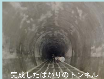
完成したばかりのトンネル