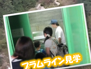
フラムライン見学

別紙の申し込み用紙にご記入の上、 FAXまたはE-mail、電話でお申し込み下さい。 電話での申し込みは、平日9時から17時のみです。