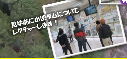
見学前に小波ダムについて レクチャーします！