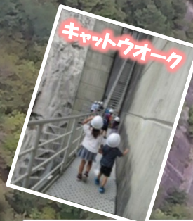
キャットウォーク