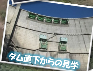
ダム直下からの見学