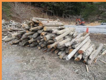
○2m程度に切り揃えたもの