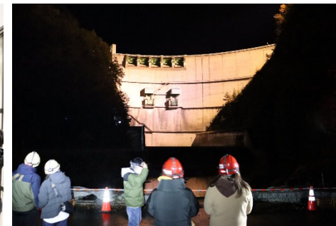
ライトアップ(ダム下流)