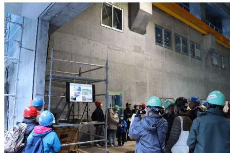
美和発電所(工事中)