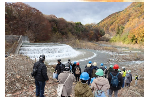
土砂バイパストンネル吐口