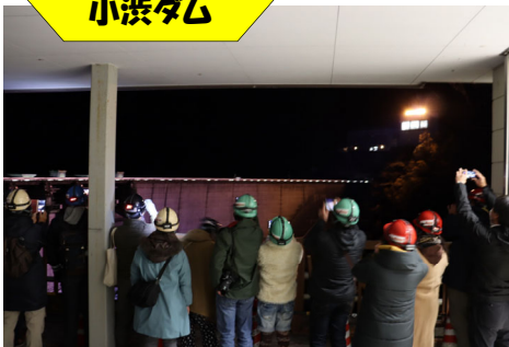
ライトアップ(点灯)