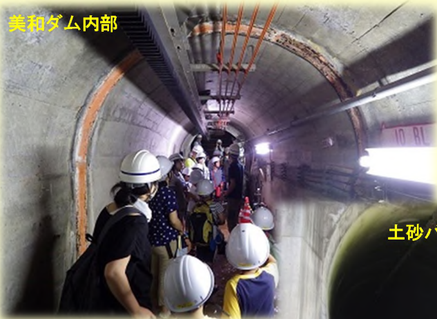
土砂バイパストンネル