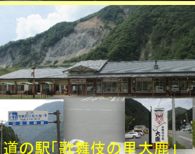
道の駅「歌舞伎の里大鹿」