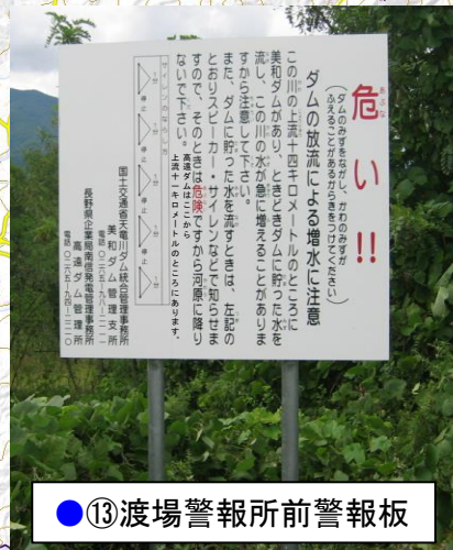
● ⑬ 渡場警報所前警報板