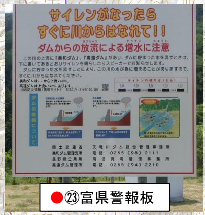
● ⑳ 富県警報板