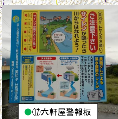
● ⑰ 六軒屋警報板