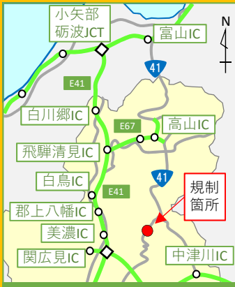
岐阜県広域位置図