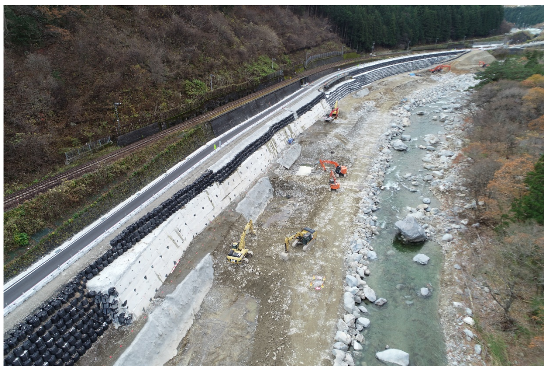
被災箇所 現在の状況(上流から下流を望む)