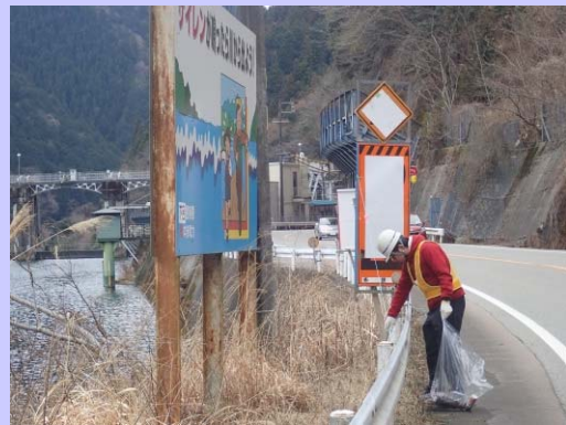
道路脇の清掃作業