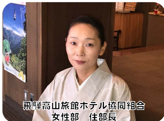
飛騨高山旅館ホテル協同組合 女性部 住部長