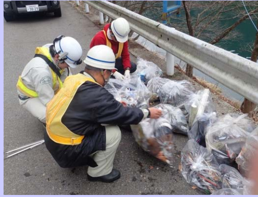
多くのゴミが集まりました...