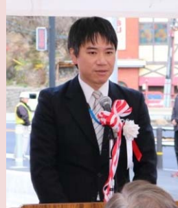
和賀高山国道事務所長