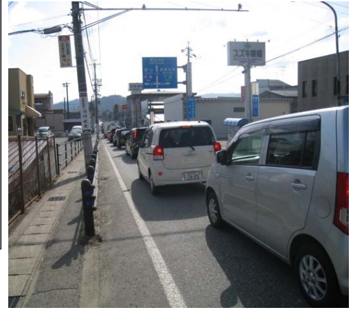
写真：上岡本町南交差点の渋滞の様子(H28.4.15)