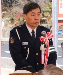
山内下呂警察署長