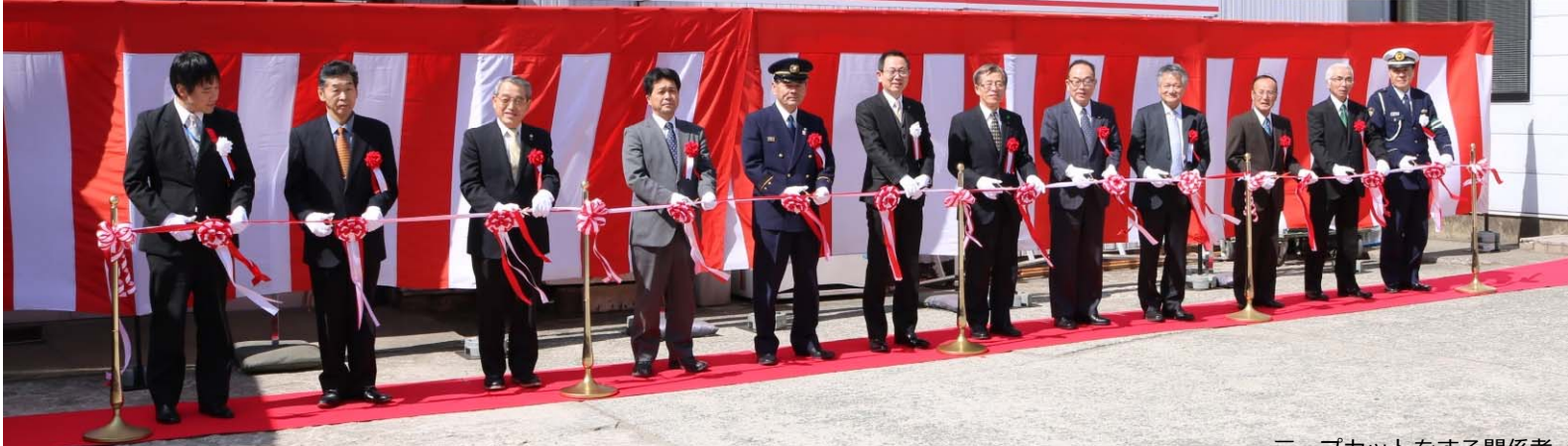
テープカットをする関係者