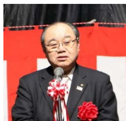
期待のメッセージ 堀コンベンション 協会長