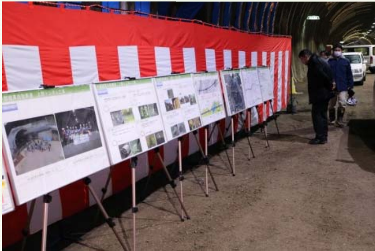
事業概要及びストック効果のパネルを展示