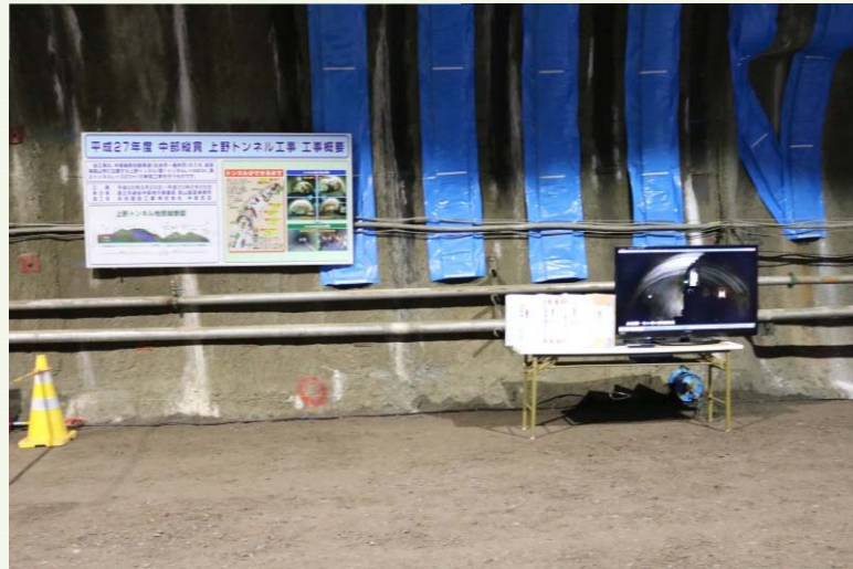
第1トンネル貫通の瞬間のビデオ上映なども実施しました