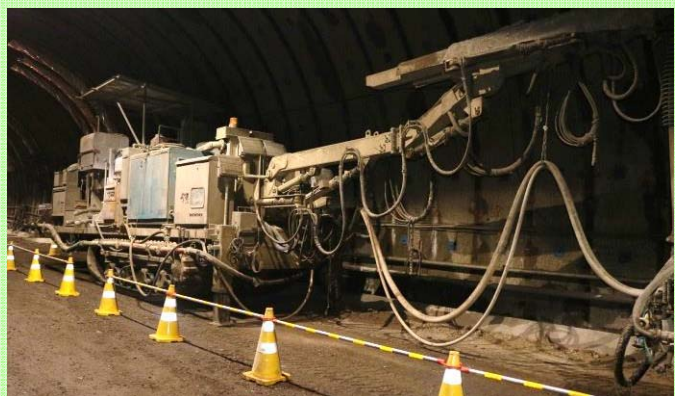
コンクリート吹付機：掘った穴が崩れないようにコンクリートを吹き付ける機械