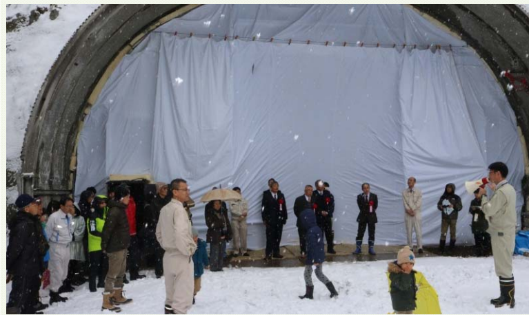
式典後、来場者を第2トンネル坑口（写真右）に案内し、現場見学を実施