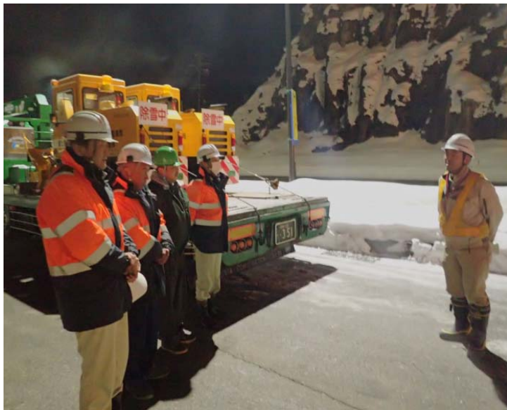
現地に出発前、永富高山維持出張所長より指示を受けるオペレーター

翌14日より作業を開始し16日までの3日間、延べ6.8km歩道除雪を行い、17日に帰還しました。現地で作業されたオペレーターの皆さん、お疲れ様でした。