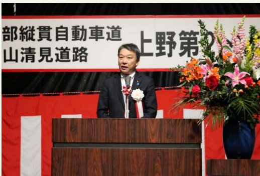
大野大臣政務官による主催者挨拶