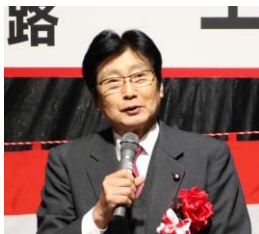
来賓挨拶 金子衆議院議員