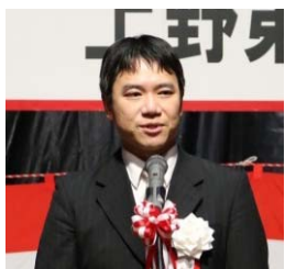
事業説明 和賀高山国道事務所長