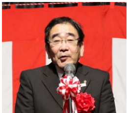
期待のメッセージ 北村商工会議所会頭