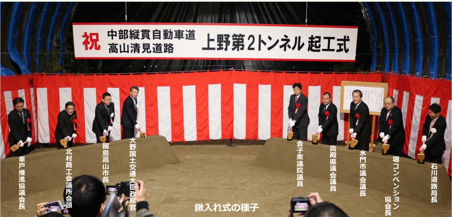
車戸推進協議会長

平成29年2月5日（日）、国会議員、岐阜県土木技監、県議会議員、高山市長、地元関係者など総勢約150名にご出席いただき、「中部縦貫自動車道 高山清見道路 上野第2トンネル起工式」を開催しました。