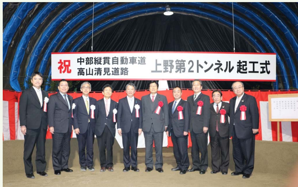
左から、和賀高山国道事務所長、國島高山市長、塚原中部地方整備局長、石川道路局長、大野大臣政務官、金子衆議院議員、高殿県議会議員、水門市議会議員、北村商工会議所会頭、堀コンベンション協会会長