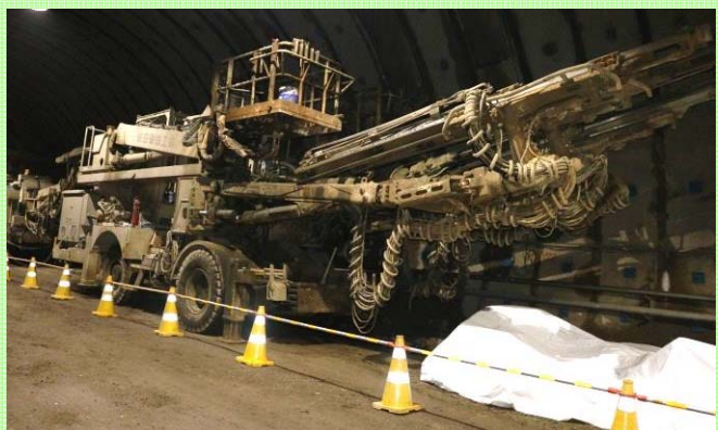
ドリルジャンボ：ダイナマイトを仕掛ける穴などを掘る機械