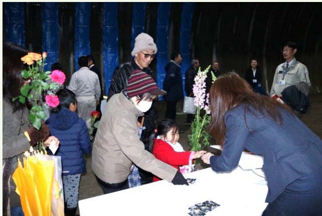
来場者“先着100名”に上野第1トンネルの貫通石をプレゼント