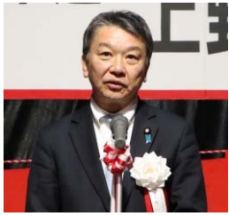
主催者挨拶 大野大臣政務官