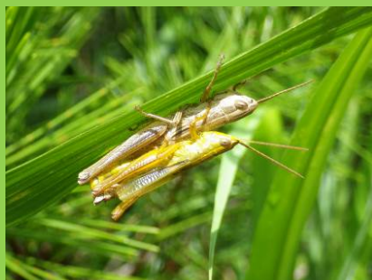
ナキイナゴ(初夏に出現)