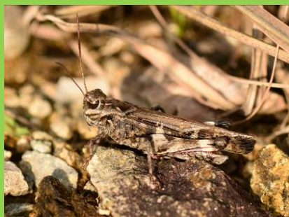
クルマバッタモドキ