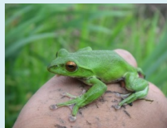
確認された重要種 (モリアオガエル)