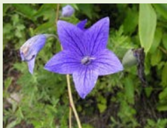
移植した重要種 (キキョウ)