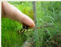
確認された重要種 (マルタンヤンマ)