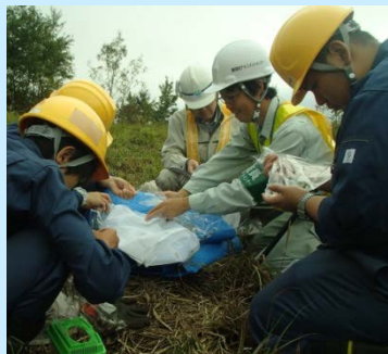
採集したバッタの分類