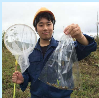
バッタの採集状況