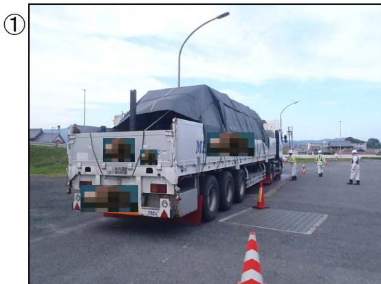
① ドライバーへの説明・特殊車両通行許可証の確認 (平成28年10月20日: 三重県伊賀市)