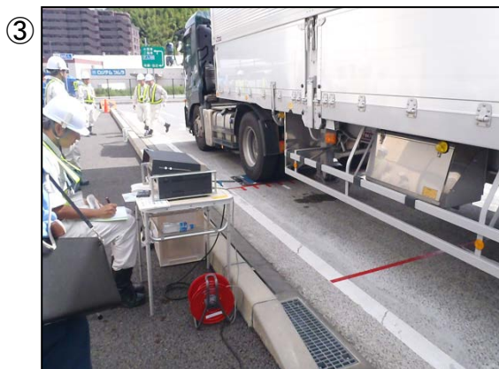
③ 車両重量の測定 (平成28年8月3日: 静岡県藤枝市)