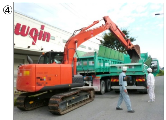
④ 積載物の軽減作業 (平成28年9月27日: 岐阜県海津市)