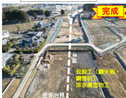
R4.名滝地区道路建設工事