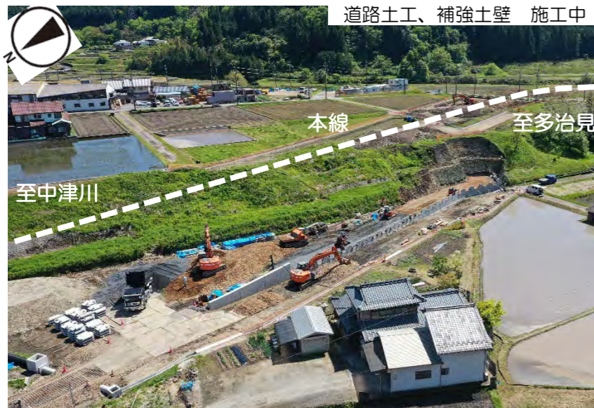
現在は本線の掘削と補強土壁工を進めています。