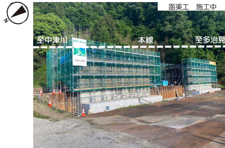
現在、2-2号門型函渠工の型枠、鉄筋、コンクリート打設作業を行っています。引き続き工事のご協力をお願いします。