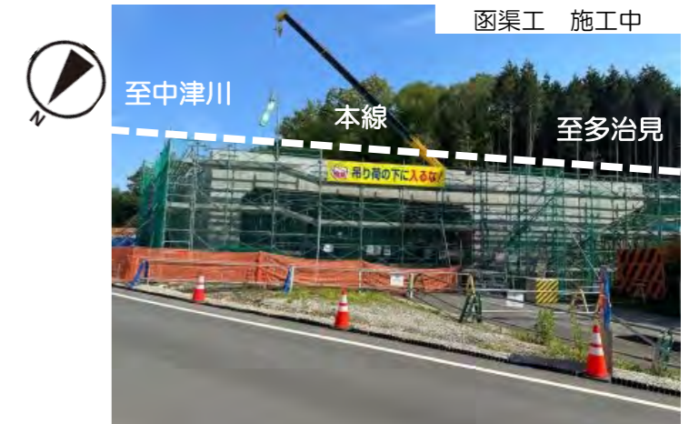
3-2号函渠工の型枠・鉄筋組立、コンクリート打設を施工しています。引き続き工事のご協力をお願いします。