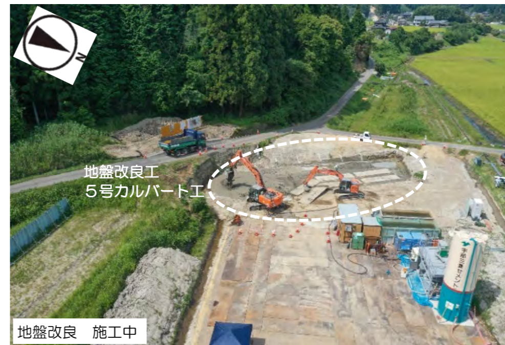
④ R1.公文垣内地区道路建設工事