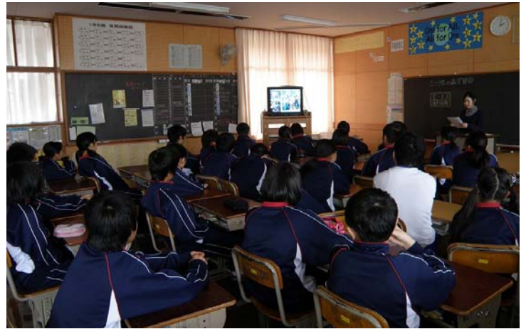
ビデオ学習の様子