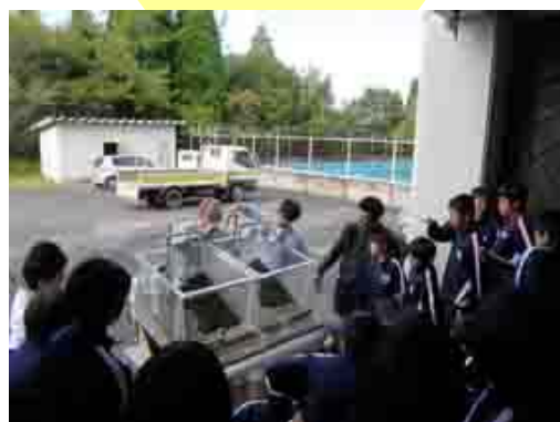
土砂災害と森の働き ～土砂流出実験～