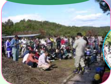
グリーンベルトに関する講義