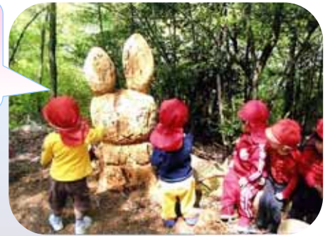
炭焼き窯が完成しました