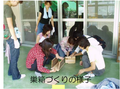
巣箱づくりの様子