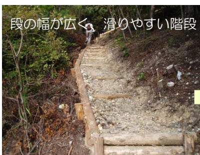
段の幅が広く、滑りやすい階段

おりべの森では、愛岐パーク団地自治会の有志が中心となって、歩道の整備、下草刈り、ベンチづくり、看板立てをしました。