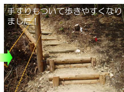
手すりもついて歩きやすくなりました！