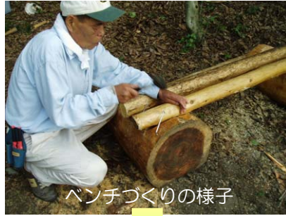
ベンチづくりの様子