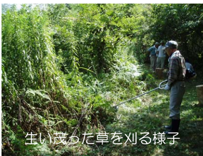
生い茂った草を刈る様子