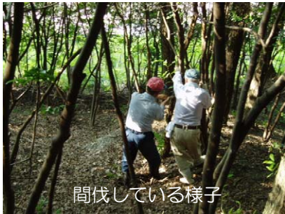
間伐している様子