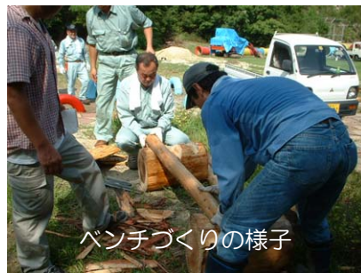
ベンチづくりの様子