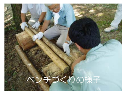
ベンチづくりの様子