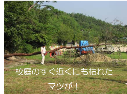
校庭のすぐ近くにも枯れたマツが！