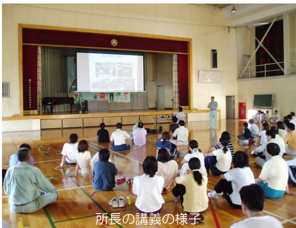
所長の講話の様子

この活動は、森づくりを通して、生活環境を改善することはもちろん、森の防災機能の向上を図ることを目的として昨年からはじめました。多治見市、国土交通省多治見砂防国道事務所が支援し、市之倉地区の有志住民が中心となって取り組んでいます。