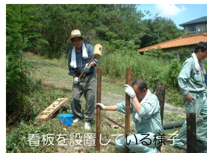
看板を設置している様子