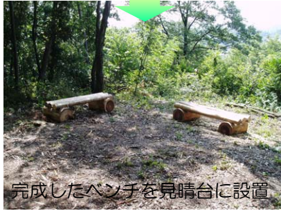
完成したベンチを見晴台に設置