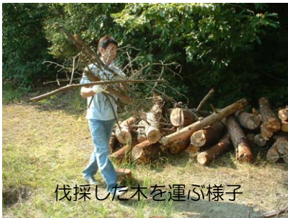
伐採した木を運ぶ様子

やすらぎの森では、市之倉小学校のPTAが中心となって、下草刈り、枯れたアカマツの伐採、ベンチづくりをしました。