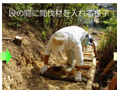
段の間に間伐材を入れる様子